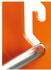
Barra di arresto regolabile