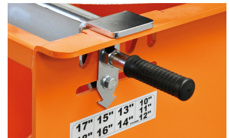
Barra di appoggio con regolazione dimensione cerchio