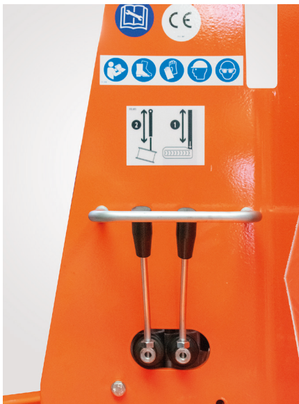
Quadro di comando